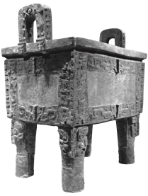
▲ 은허에서 발굴된 (가)의 유물

(가)에서 점을 치는 가장 일반적인 방법은 불에 달군 금속 막대기 등을 거북의 배딱지나 소뼈 등에 갖다 대는 것이었다. 점술가는 열로 인해 생긴 균열을 보고 제기한 질문이나 진술에 대한 점괘를 내렸다. 이렇게 점치는 데 사용된 배딱지나 뼈에는, 예를 들어 제물로 바친 소가 마땅하였는가 등과 같은 내용이 새겨져 있었다. 때로는 왕이 치통을 앓거나 꿈을 꾸게 된 이유를 묻는 내용이 새겨지기도 하였다.